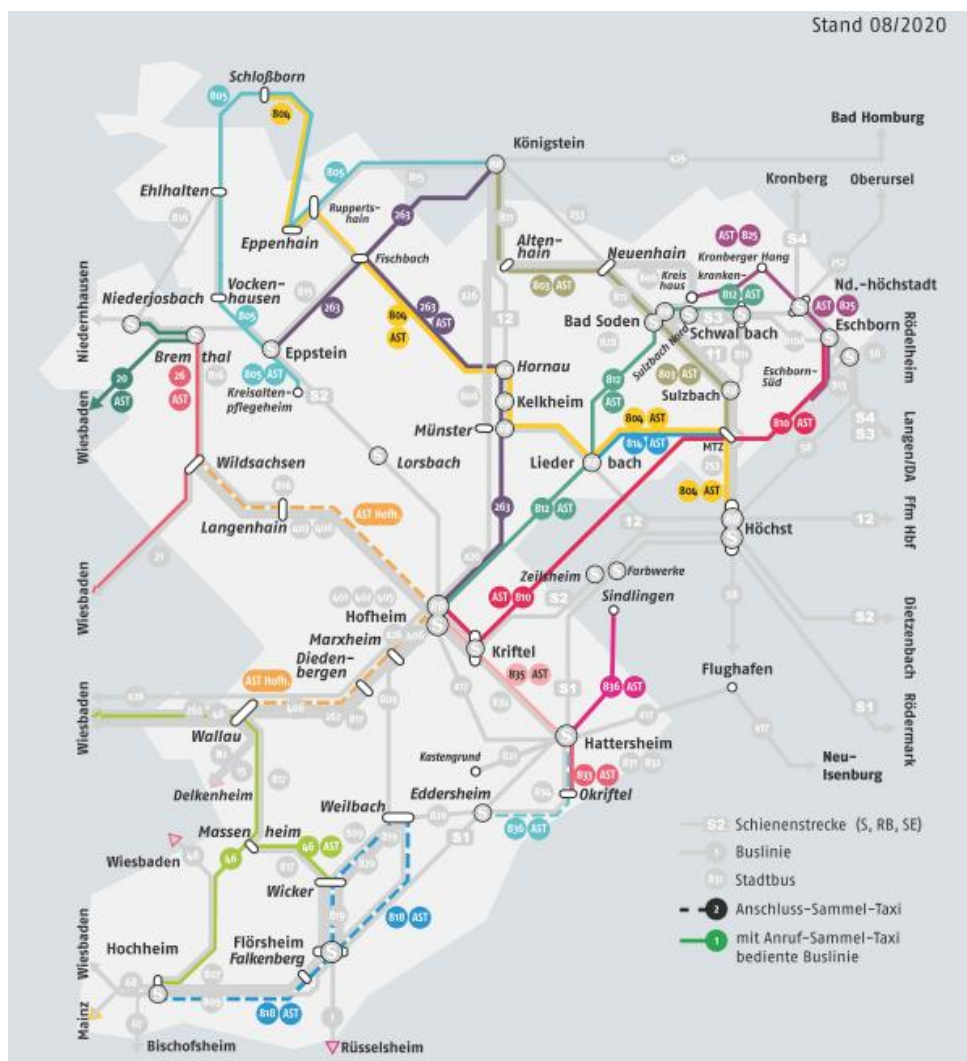
Abbildung 5, AST-Angebote der MTV

Die folgende Karte zeigt die Ast-Angebote im Zuständigkeitsgebiet der MTV: