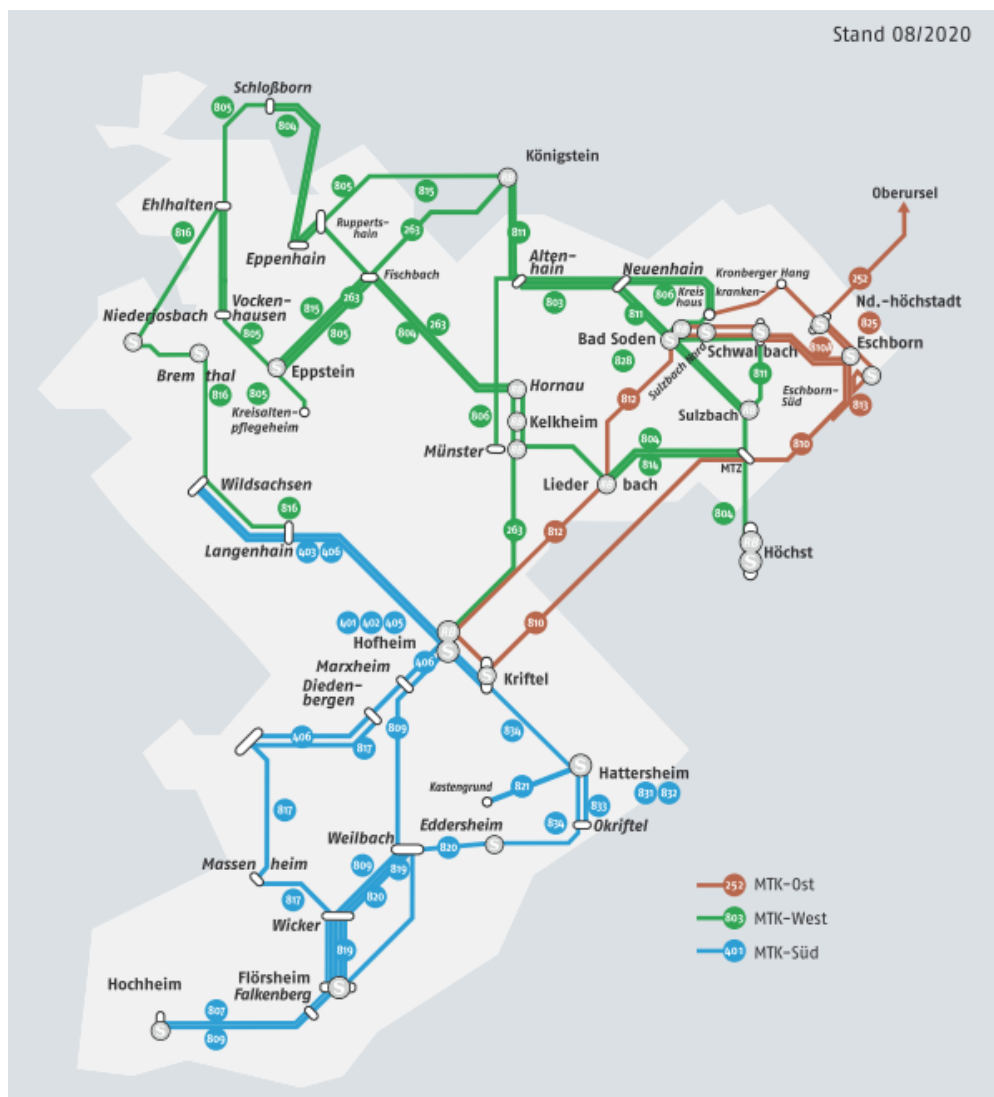
Abbildung 4: Liniennetz im MTK, Stand 2020

Die folgende Karte zeigt die Verteilung der Linienbündel im Zuständigkeitsgebiet der MTV: